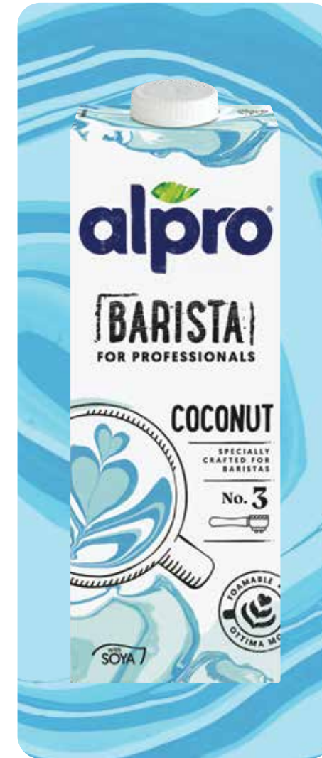
ALPRO BARISTA FOR PROFESSIONALS COCONUT Exotischer Geschmack von Kokosnuss

Verfügbar in 1L-Packungen (Karton 8 x 1L), UHT-Produkt. Gekühlt und innerhalb von 5 Tagen nach Öffnung verwenden.