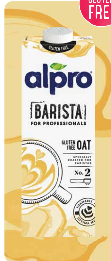
ALPRO BARISTA FOR PROFESSIONALS HAFER Natürlich milder Hafergeschmack, glutenfrei

Verfügbar in 1L-Packungen (Karton 12 x 1L), UHT-Produkt. Gekühlt und innerhalb von 5 Tagen nach Öffnung verwenden.